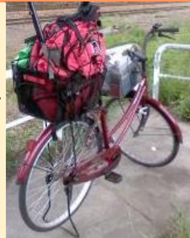
▲この自転車に乗って旅に……