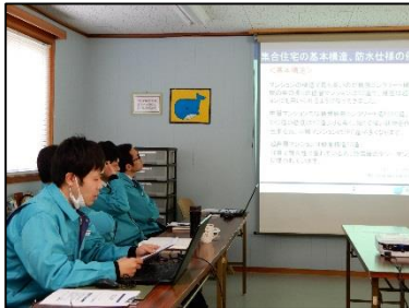
▼セミナー発表に向けて、プレゼンの練習を行っています。

2012年より始めました防水ノウハウセミナーも今年で第7弾を迎えます。今年、建物種別ごとの漏水事象・漏水原因・漏水対処法や漏水予防法について、事例も交えながらお伝えさせていただきます。そして、今回は建物種別ごとにグループを作り発表するスタイルで行います。詳しい詳細は、同封の防水セミナーのチラシをご覧ください。皆様のご来場をお待ちしております！！