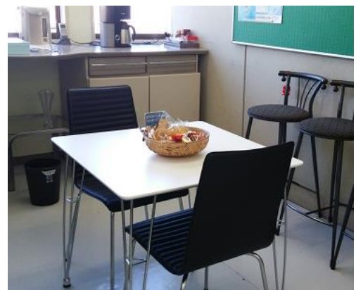
▲営業所の応接セットを新しくしました