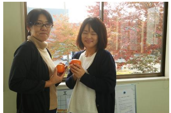
▲秋の味覚は柿です