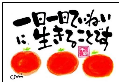
▲「仕事が上手くゆくことだま」作：ことだま・千絵子

もう11月なのでですね。一年が早く感じるとともに、一日一日を大切に丁寧に生きたいと思うこの頃であります。振り返ると、随分たくさんの人に出逢い、お世話になって来ましたね。